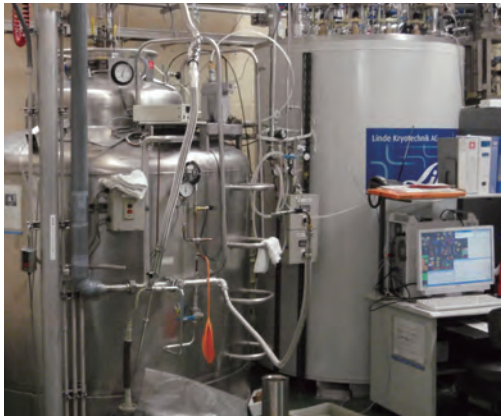
ヘリウム液化システム（東6号館121号室）