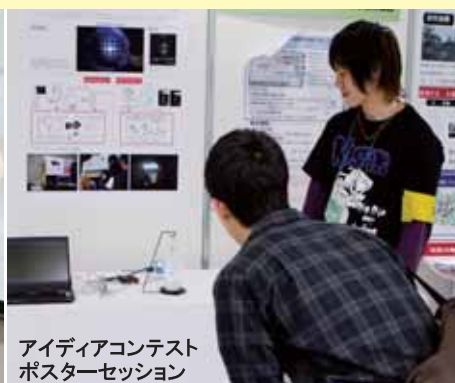
アイデアコンテスト ポスターセッション