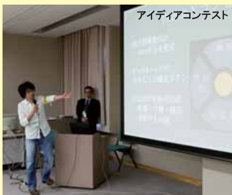
アイデアコンテスト